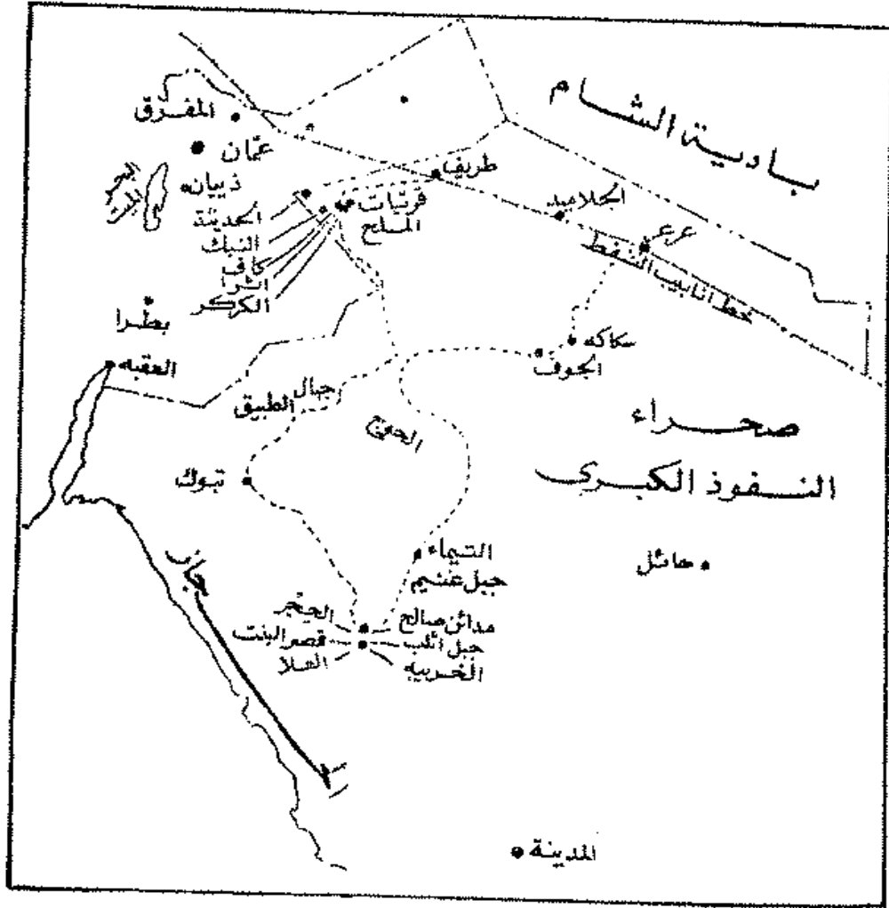
خريطة رقم (٣) شمال الحجاز